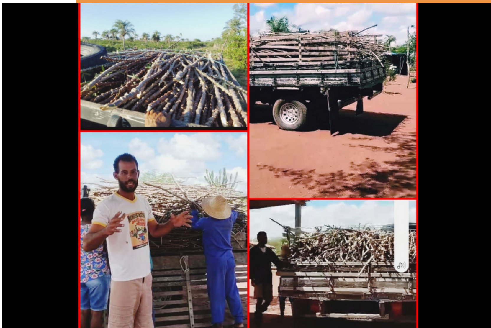
foto: assentamento Primeiro de Abril.