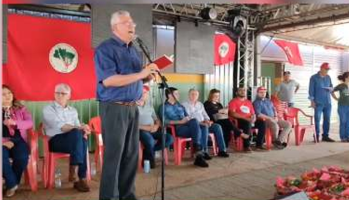
Dom Geremias Steinmetz, Bispo de Londrina