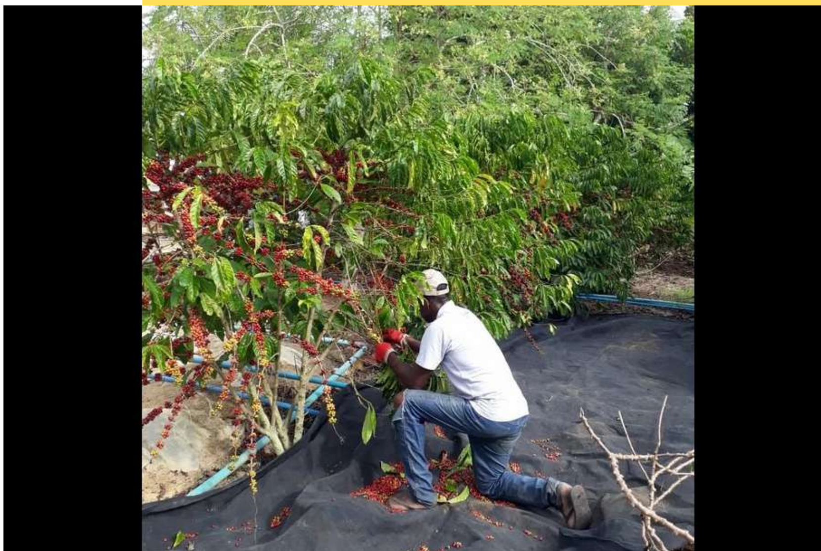
Formigueiro do Extremo Sul da Bahia.