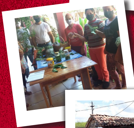
Figura 7 – Hierbas, medicinas populares y otras medicinas naturales como parte del contenido compartido en la capacitación de Agentes Populares de Salud Rural em Estado Paraná y Estado Ceará