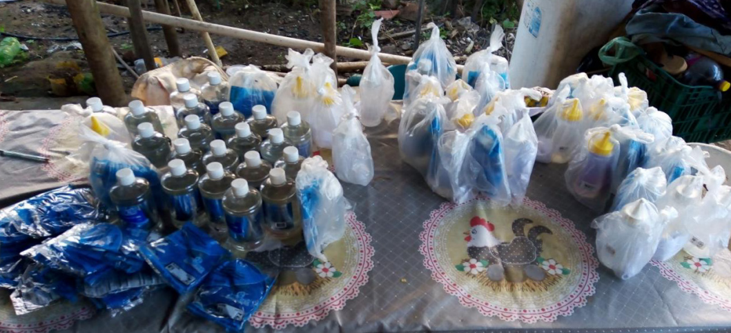
Figura 3 – Kits de seguridad Covid-19 con alcohol al 70% y mascarilla en Estado Minas Gerais

Incluidos en una gran estrategia de acción colectiva a través del trabajo de base en campañas y brigadas de solidaridad en las periferias urbanas y rurales, se formaron más de 2.000 Agentes Populares de Salud Rural. Junto con la campaña nacional “Periferia contra el Coronavirus”, el MST ha formado una red de atención en todo Brasil mapeando las necesidades básicas de las comunidades, donando más de 5.000 toneladas de alimentos y 1 millón de