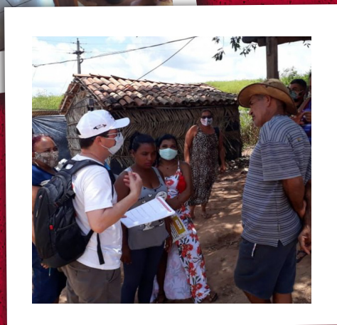
Figura 8 – Agentes Populares de Salud Rural en acción en Estado Paraíba