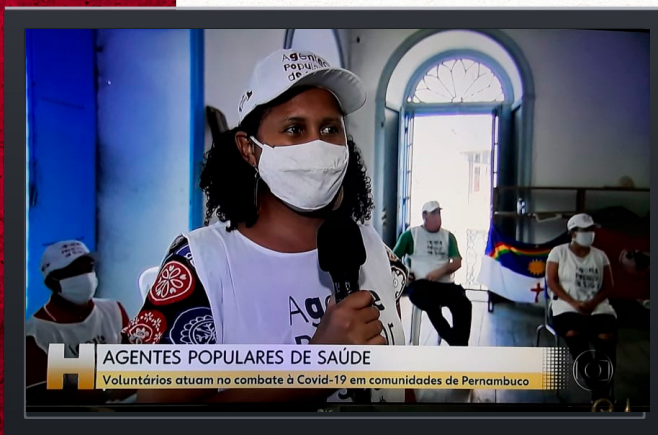
Figura 1 – Reportaje en televisora acerca de los Agentes Populares de Salud Rural en Estado Pernambuco

La pandemia del COVID-19, el desastroso contexto actual del gobierno brasileño en cuanto al enfrentamiento de la crisis sanitaria en el país, las manifestaciones autoritarias que amenazan la democracia y el estado de derecho, el total desprecio por las poblaciones más pobres han dibujado un Brasil cada vez más injusto y desigual. Insertados en esta realidad de pérdida de derechos y extrema desigualdad social, varios movimientos populares han creado acciones impulsadas por la solidaridad y la transformación de la conciencia. El cuidado es una práctica del Movimiento de los Trabajadores Sin Tierra y, a partir de la necesidad urgente de cuidar la salud del pueblo, el sector de la salud del MST comenzó a formar a miles de Agentes Populares de Salud Rural .