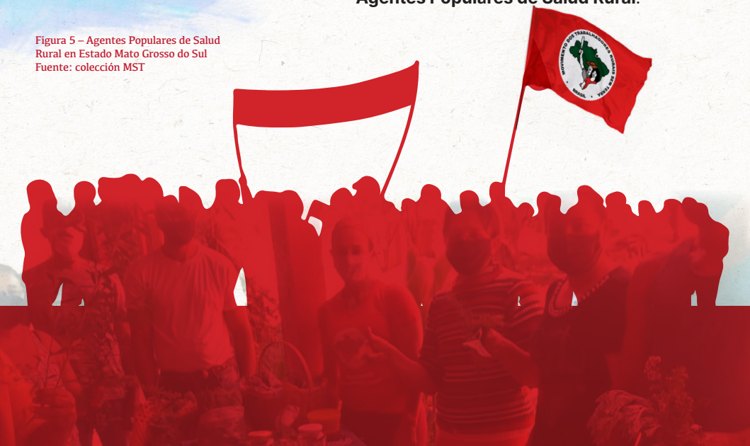
Figura 5 – Agentes Populares de Salud Rural en Estado Mato Grosso do Sul

Cuidar la salud de la gente, salvar vidas, luchar por el acceso a la tierra, por las vacunas, por una alimentación de calidad en cada mesa, garantizar la educación popular a partir de los conocimientos existentes en las comunidades rurales, crear lazos de unión y lucha contra el sistema que nos enferma y oprime. Son fuerzas de combate defendidas y experimentadas por los Agentes Populares de Salud Rural .